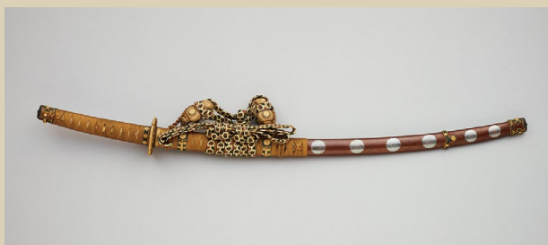
『太刀 銘 国村 (拵)』 鎌倉時代末期 徳川家治奉納

鎌倉に息づく悠久の歴史は、源頼朝から大きく動き出し、その後も中世を駆け抜けた將軍や時代を彩った文豪たちが足跡を残していきました。その物語を次世代に語り継ぐため、当館では鎌倉をテーマに歴史や文化、今日まで守り育まれてきた豊かな自然などを紹介し、それぞれの社寺や史蹟、文化施設に赴くための情報発信の拠点として活動を行っております。 季節展『鶴岡八幡宮のいまとむかし』は、時流の中の鶴岡八幡宮の姿に迫ります。武家の守護神としての信仰、大銀杏の軌跡、時代による境内の変遷などの当宮が辿ってきた歴史をご覧ください。 また、かつて当宮の石段脇にたたずんでいた大銀杏の倒伏から今年で15年目となりました。今なお鶴岡八幡宮の象徴としてたくましく生き続ける銀杏のかつての姿に思いを馳せていただきたく存じます。