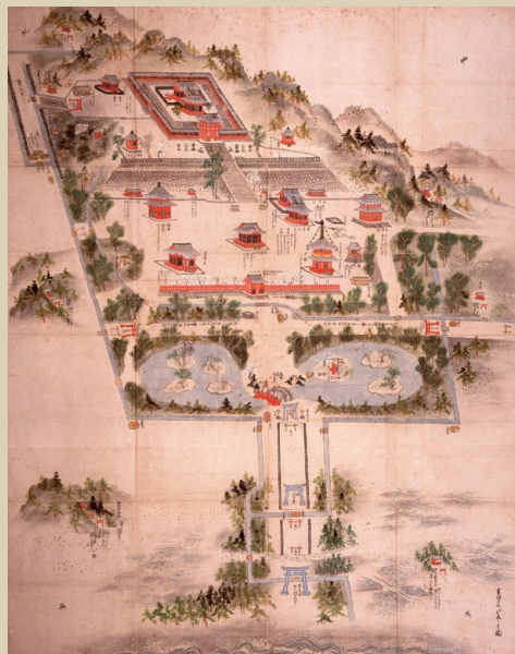
『鶴岡八幡宮境内図』 享保17年(1732)