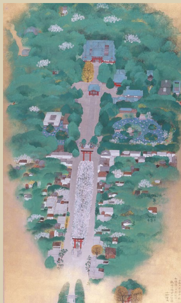
『鶴岡八幡宮四季図』 平成3年(1991) 中島千波