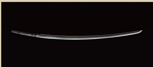
『太刀 銘 国村 (刀身)』 鎌倉時代末期 徳川家治奉納